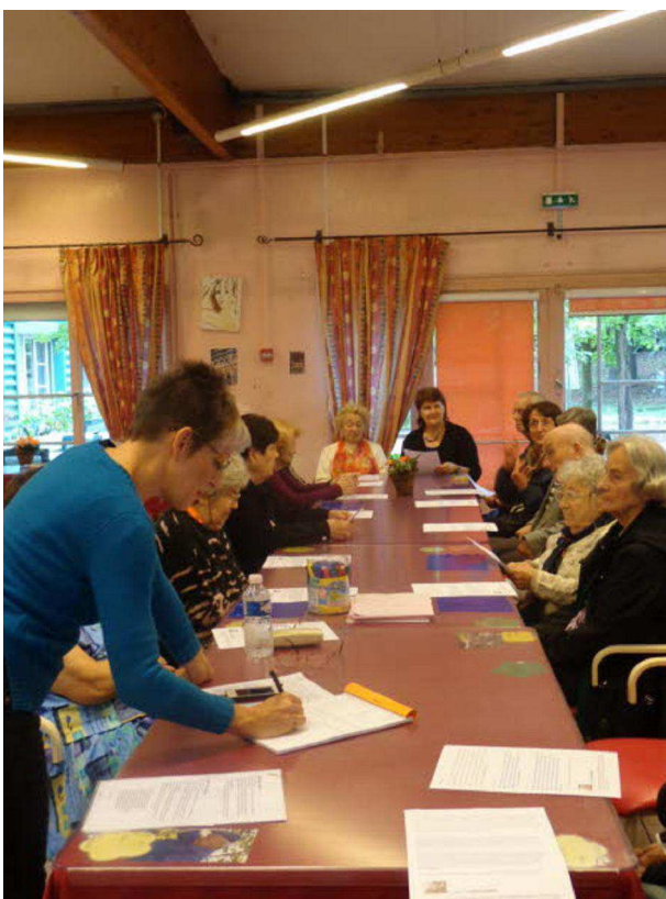
Les seniors ont mis la main à la pâte.

TAGS ASSOCIES | Rhône | Feyzin | Vénissieux et sa région